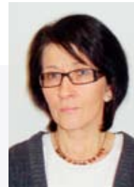
Maire Peltonen Keittiökalusteet