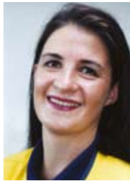
Anitta Kurki Sisustus/valaistus