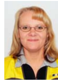
Heli Puhakka Sisustus