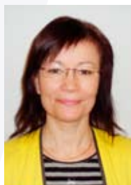
Tarja Suppola Puutarha