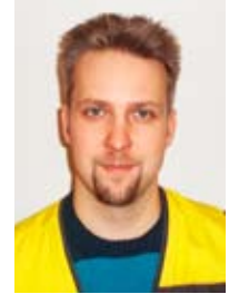
Saku Lindroos Rakennustarvike