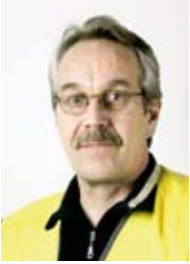
Reino Tossavainen Puutavara